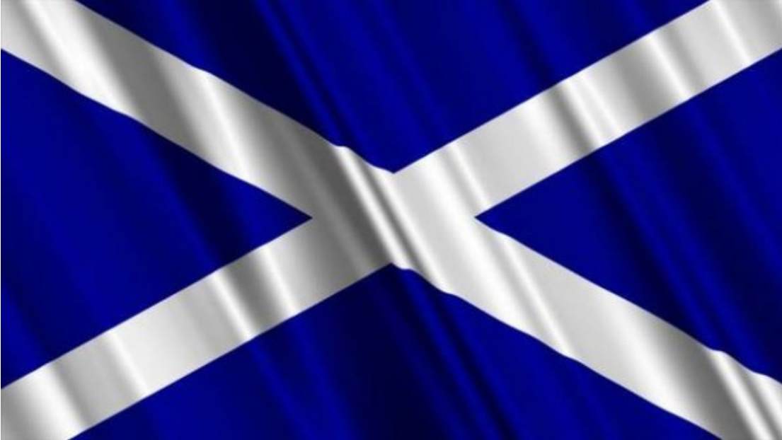
drapeau de l'écosse