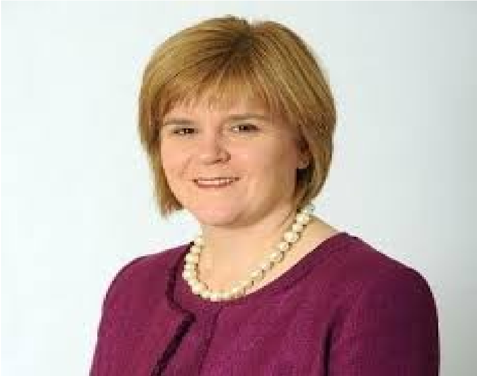
Nicola Sturgeon 1er ministre d'Ecosse

La reine Elisabeth II n'est pas que reine de l'Ecosse, mais aussi reine du Pays de Galles ,du Canada, de l'Australie,de la Nouvelle Zélande et d'autres pays encore.