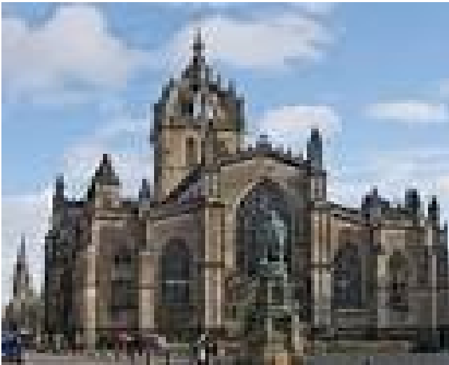
catédrale Saint-Denis d'Edimbourg