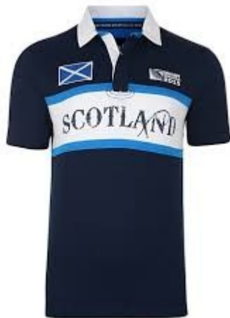
tenue de rugby

L'Ecosse a une légende de rugby qui est Chris Paterson qui a remporté le record de sélections de 109 sélections et le record de points de 809 points