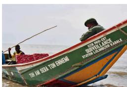
Embarcation pour les patrouilles des gardes de parcs.

→ Organisé des conférences à l'université de Goma (Rd-Congo), sur les radios locales du Kivu (Rd-Congo).