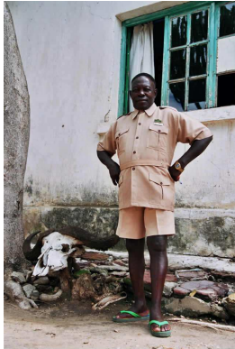
Ancien garde de parc.