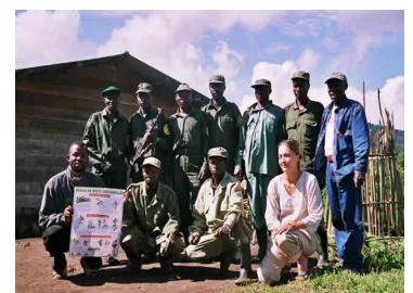
Equipe de gardes de parc du secteur des Gorilles. (Parc national des Virunga).