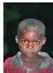
Enfant pygmée de Rd-Congo.

Objectif Brousse est la seule et unique association engagée activement pour la scolarisation des enfants de gardes de parcs et de braconniers dans cette zone du Kivu extrêmement sensible.