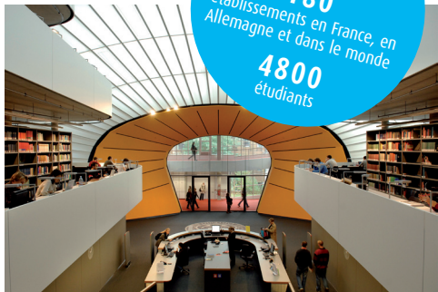
Freie Universität de Berlin

UFA mobilité, excellence, ouverture 180 établissements en France, en Allemagne et dans le monde 4800 étudiants