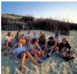
Plage de l'île de Langeoog / Mer du Nord