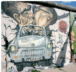
Ancien mur de Berlin