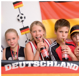
Jeunes supporters de foot