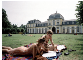
Université de Bonn

Grâce au nouveau système de diplômes reconnus en Europe, partir étudier en Allemagne est devenu encore plus simple. Pour quelques mois ou plus, les jeunes goûtent à la vie étudiante allemande, conviviale et très bien organisée. Vivre et se loger est souvent moins cher qu'en France. Les jeunes découvrent une organisation différente des études, dans un pays où la tradition universitaire est gage de qualité.