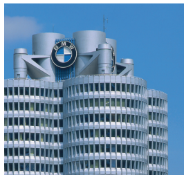
Munich : le siège social de BMW par l'architecte K.Schwanzer