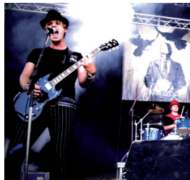
Concert de LaminiusX au Goethe-Institut