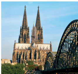
Cologne : cathédrale sur le Rhin