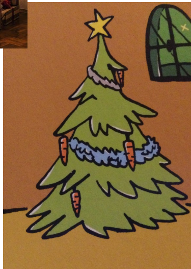
Une couronne de Noël