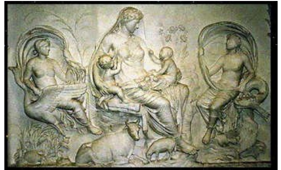
Gaïa et ses enfants Bas relief visible à Rome

Qu'est-ce que le chaos ? C'est le commencement. Il n'y avait rien.