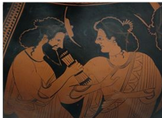
Hermès et Maïa, détail d'une poterie antique. 500 avant J. C.

À qui semble appartenir le troupeau de vaches ? À personne.