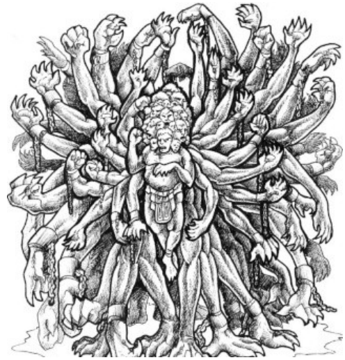
Les géants aux cent bras

Quel phénomène naturel explique ce mythe ? Les volcans.