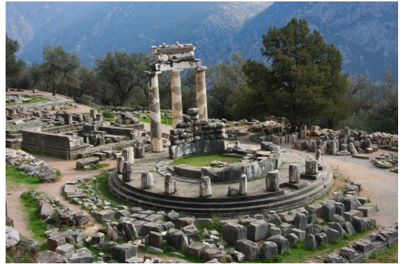
Le mont Parnasse

Qu'apprend la nourrice à Hermès ? À voir ce qui existe autour d'Hermès.