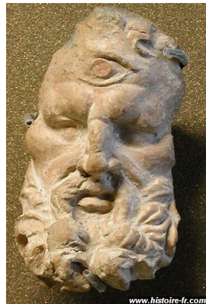
Tête de cyclope, musée du Louvre.

D'où vient, d'après ce mythe, la lave des volcans ? De feu de la forge.