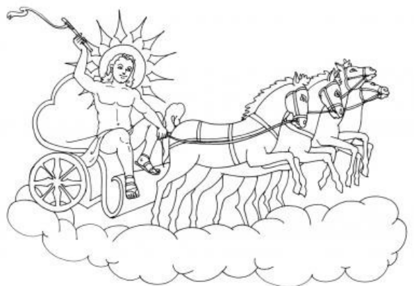
Le char solaire

Pourquoi Hermès est-il intrigué par le volcan ? Car il ne sait pas ce que c'est et qui provoque les tremblements du sol.