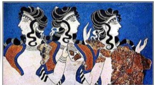
Les trois Thries

Que veut connaître Hermès ? La naissance du monde.