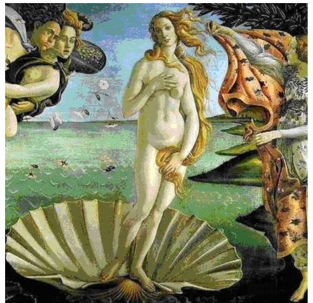
La naissance de Vénus Botticelli

D'où vient-elle ? Elle vient de la mer, « des flots ».