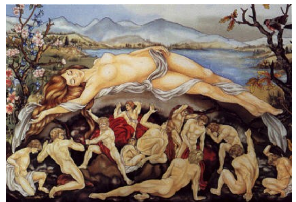
Gaïa et les Titans Ann Lan