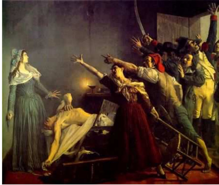
Assassinat de Marat par Jean Joseph Weerts 1886, Musée Art et Industrie Roubaix