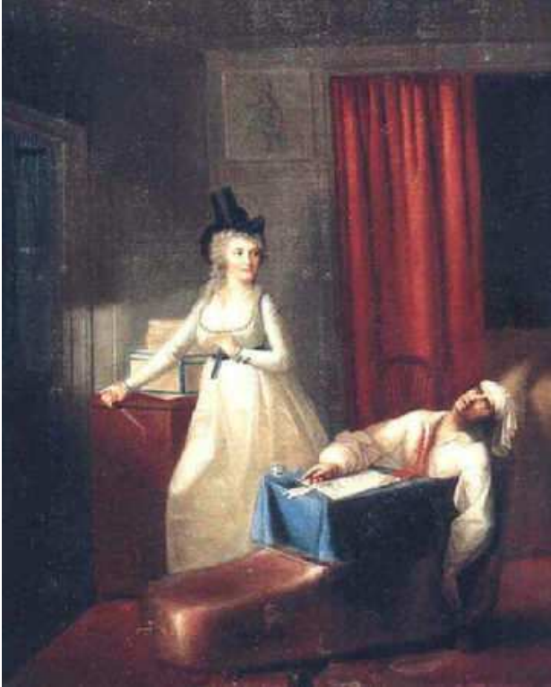
La mort de Marat par Jean-Jacques Hauer , Musée Lambinet Versailles