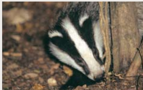
Le blaireau n'a pas une bonne vue, mais son ouïe et son odorat sont très développés.