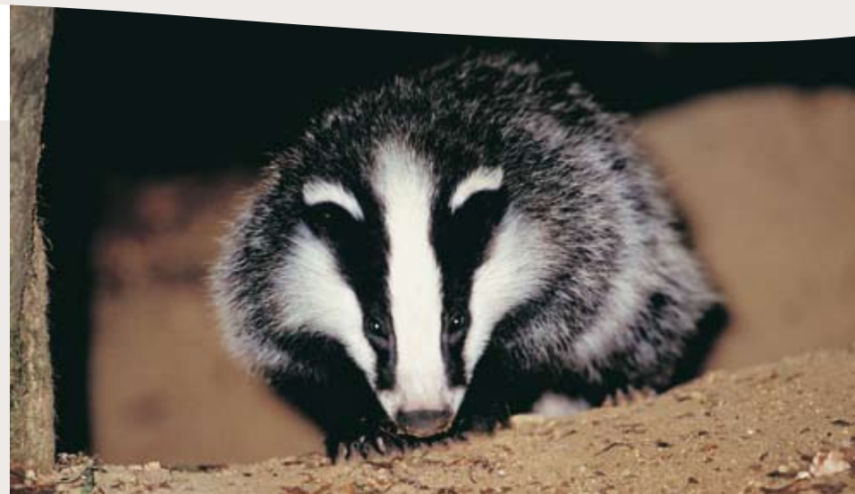
Le blaireau se reconnaît facilement à sa tête blanche barrée de deux bandes noires.