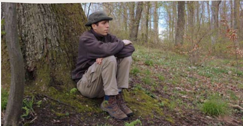
L'affût demande patience et discrétion...

Le suivi d'une famille de blaireaux évoluant devant son terrier est un spectacle enthousiasmant qui demande de la préparation et une grande discrétion. Voilà quelques conseils à suivre pour observer sans déranger.