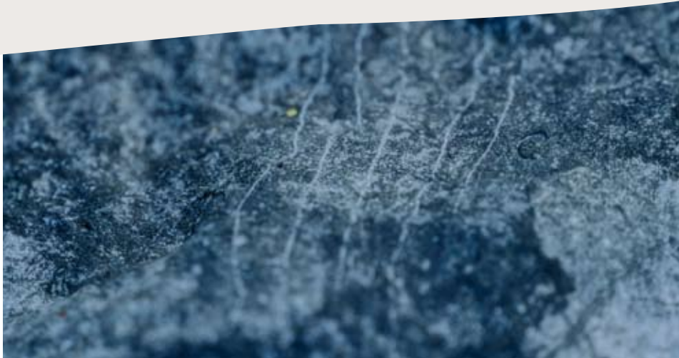
En marquant les alentours de son terrier, le blaireau laisse parfois sur les troncs ou les grosses pierres des traces très nettes des griffes de ses pattes antérieures.

Toute action de gestion ou de conservation d'une espèce requiert de connaître ses effectifs et leur évolution. En l'absence de suivi spécifique, les effectifs de blaireaux sont parfois estimés en confrontant des sources indirectes : tableaux de chasse, chiffres de piégeage, données de mortalité routière, enquêtes partielles. Cependant, ces méthodes sont imprécises et peuvent conduire à des résultats peu fiables. Une méthode scientifiquement reconnue consiste à dénombrer les terriers principaux en activité, puis à multiplier ce chiffre par le nombre moyen d'individus par groupe social. C'est la méthode qui a été retenue en Grande-Bretagne, en Irlande et aux Pays-Bas. Elle nécessite toutefois que les observateurs distinguent soigneusement les terriers principaux des terriers secondaires.