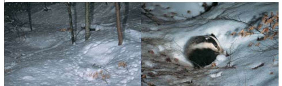
Même si les blaireaux ont une activité réduite en hiver, une visite discrète permettra de faire d'intéressantes observations.

Au vu de ces résultats alarmants, la Frapna a proposé différentes mesures pour une meilleure conservation des populations : définition de "zones de tranquillité" pour le blaireau, conservation de "terriers témoins" permettant de suivre l'évolution des populations, limitation des déterrages consécutifs sur un même terrier pour permettre au groupe social de se reconstituer, installation de couloirs boisés et de passages à blaireaux aux endroits sensibles.