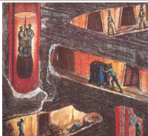
Travail dans les mines