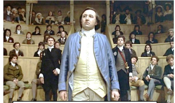
Scène du film « La Révolution française ».

Le personnage est vu de dessus, il est dominé par le spectateur. Permet d'évoquer l'idée d'infériorité, d'accablement, et parfois de solitude, de danger, etc.