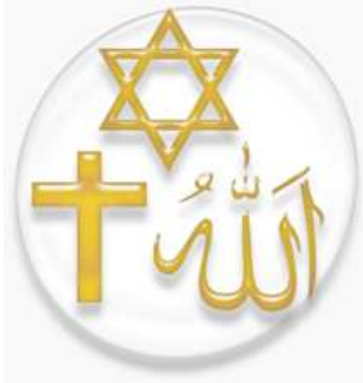
les symboles des trois religions monothéistes