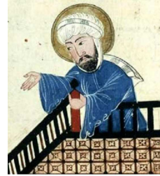
Mahomet prophète de la religion musulmane