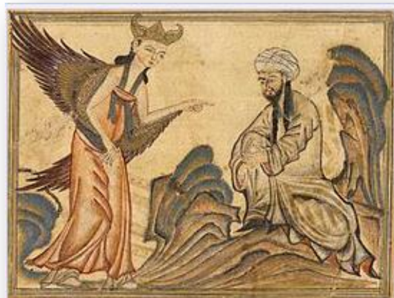
Mahomet recevant la révélation de la part de l'ange Jibril

Ils sont polythéistes et adorent plusieurs dieux. Ils se retrouvent à La Mecque, une grande oasis au centre de la péninsule, pour prier autour de la pierre noire de la Kaaba .