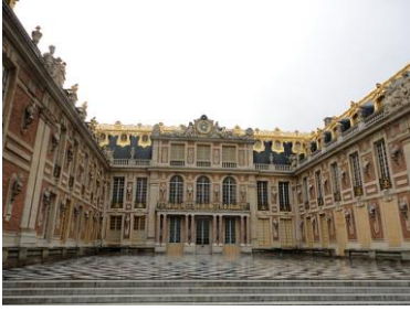
La cour de Marbre