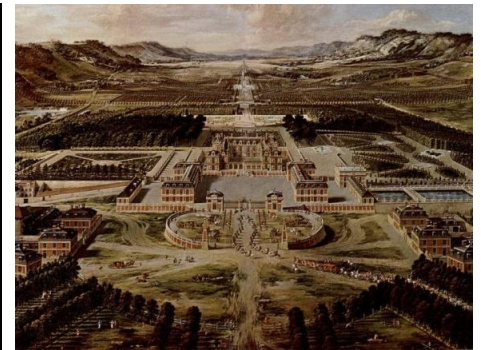
La cour emménagé à Versailles

1. Sac fourré pour garder les pieds au chaud