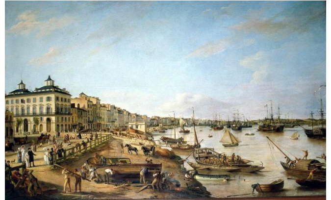
Le port de Bordeaux

a) Quel est le rôle des ministres sous Louis XIV ?