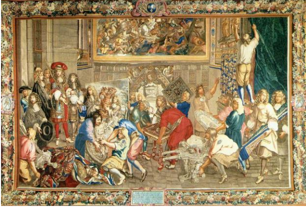
Le roi visite la Manufacture des Gobelins