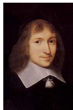
Fouquet, ministre malhonnête et ambitieux, Louis XIV le fit emprisonner à vie.