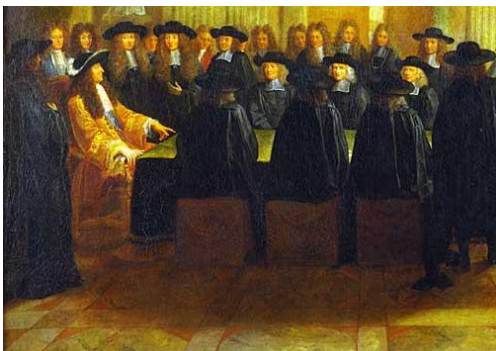
Le roi en son conseil

« Je commandais aux quatre secrétaires d'État de ne plus rien signer du tout sans m'en parler ; au surintendant de même, et qu'il ne fit rien aux finances sans être enregistré dans un livre où je pusse voir à tous moments et d'un coup d'œil, l'état des fonds et des dépenses faites ou à faire. »