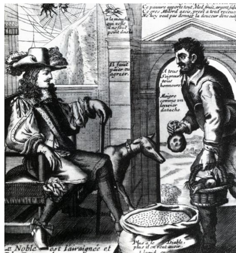
L'araignée et la mouche, illustration représentant un paysan payant ses impôts au Seigneur.

« La nuit du 5 au 6 janvier 1709, il commença un hiver qu'on appellera jusqu'à la fin du monde « le gros hiver ». Il dura trois mois et fut d'une force incroyable, entremêlé de neige que le vent chassait dans les endroits les plus bas, de sorte que tous les blés furent gelés. Les plus gros chênes des bois se fendaient sous le gel. Les pruniers, les cerisiers moururent et les autres arbres furent gelés. Dès que les marchands de grains virent les grains gelés, ils haussèrent le prix et le grain, qui se vendait l'année précédente une livre et huit sous la mesure, se vendait douze livres.