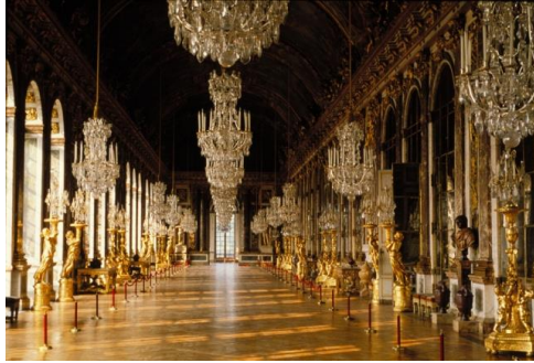
La galerie des glaces