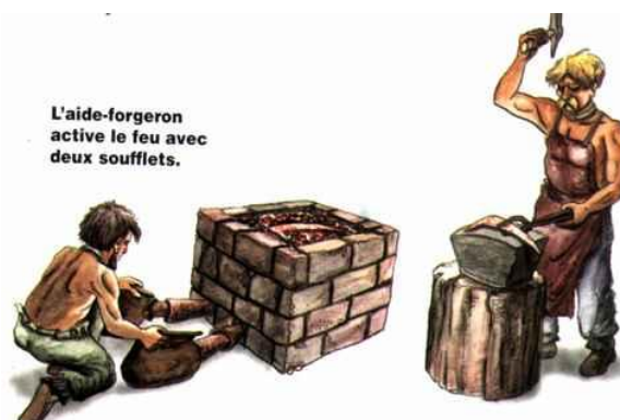
L'aide-forgeron active le feu avec deux soufflets.

Ils pratiquaient également le commerce avec leurs voisins. La Gaule celtique était un territoire riche et puissant.