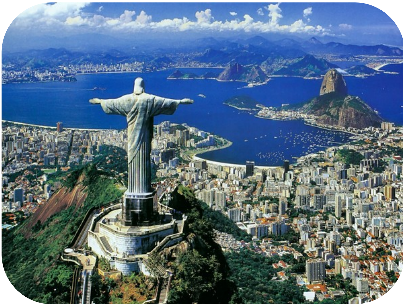
Rio de Janeiro.