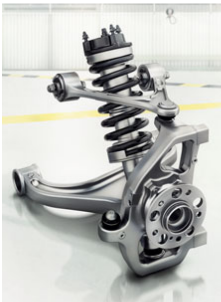
Train de roulement sport RIDE CONTROL AMG.