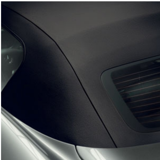
Capote en tissu noir.