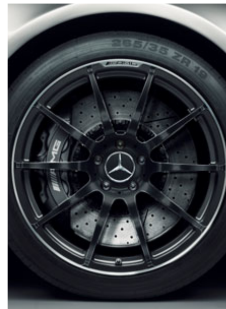
Jantes forgées AMG à 10 branches, finition noir mat, rebord brillant.