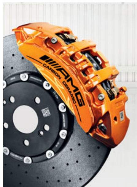
Système de freinage en céramique composite AMG hautes performances.