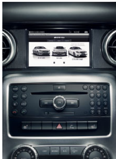
Option. AMG Performance Media, fonction Internet.