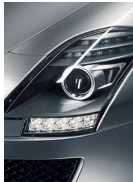
Projecteurs bi-xénon avec feux de jour à LED intégrés.