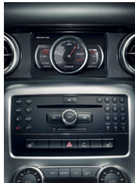
Option. AMG Performance Media, affichage du couple, de la puissance et de la position de l'accélérateur.