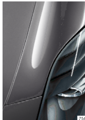
Marron Sepang AMG