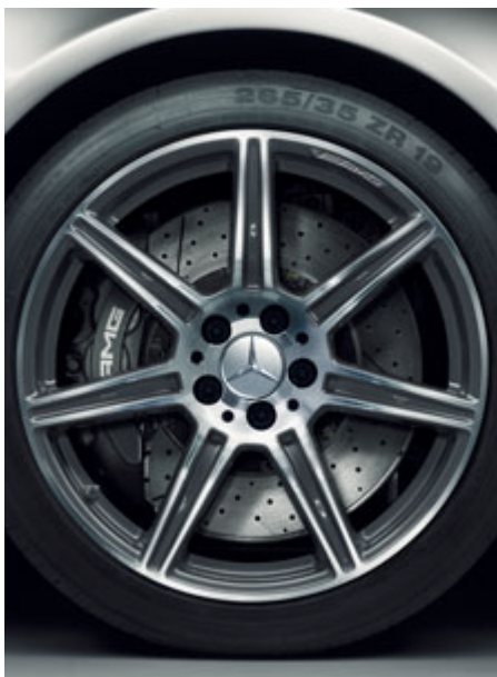
Jantes alliage AMG à 7 branches, finition gris titane brillant.