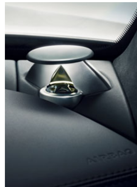
Option. Système Bang & Olufsen BeoSound AMG, lentille audio du haut-parleur d'aigus éclairée.