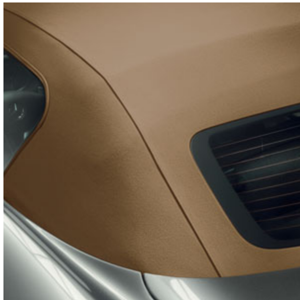
Capote en tissu beige.