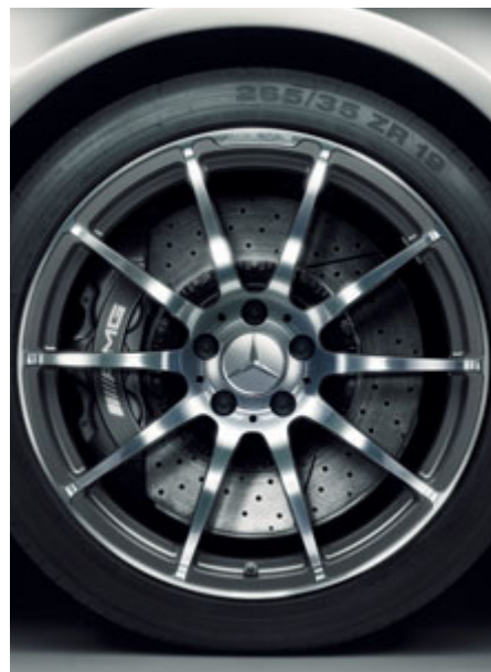
Jantes forgées AMG à 10 branches, finition gris titane brillant.