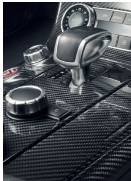
Inserts décoratifs en carbone AMG.