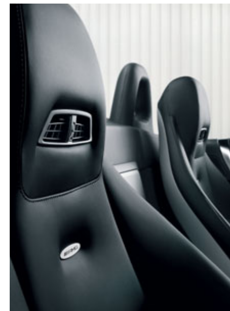
Chauffage de nuque AIRSCARF.