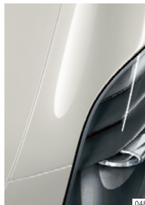
Gris allanite magno designo