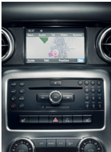
Équipement de série. Visuel couleur TFT 17,8 cm avec représentation cartographique haute résolution.