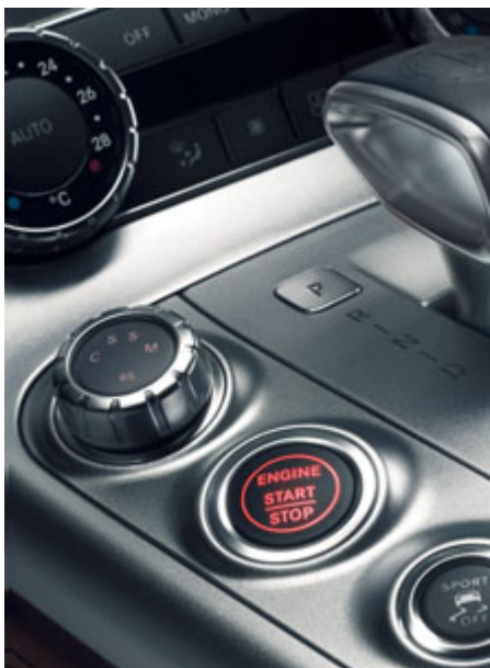
DRIVE UNIT AMG avec levier sélecteur E-SELECT et fonction de démarrage sans clé KEYLESS-GO.