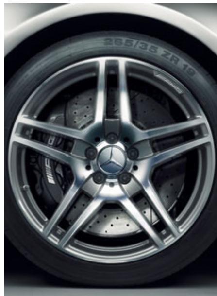
Jantes alliage AMG à 5 doubles branches, finition gris titane brillant.