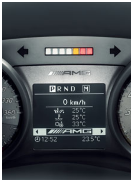
Combiné d'instruments AMG avec indicateur de passage des rapports à 7 LED.