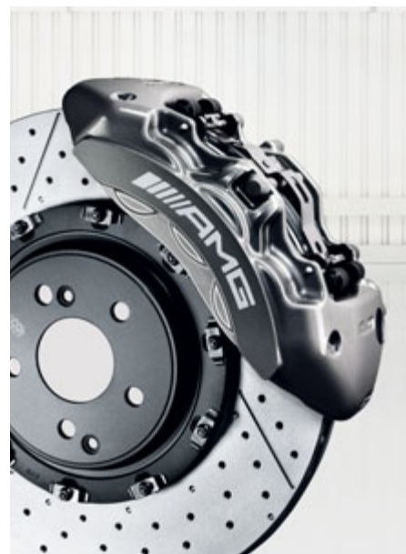
Système de freinage composite AMG hautes performances.