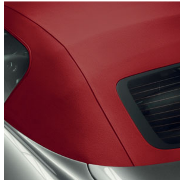
Capote en tissu rouge.