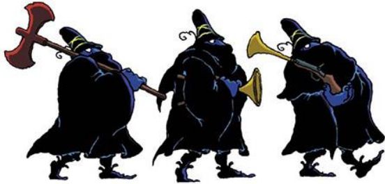
les trois brig g ands