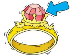
Une ba g e