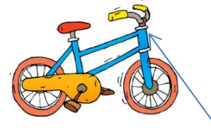
Un g idon