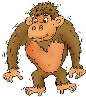
Un g orille