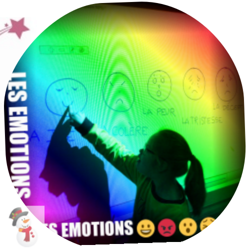
Les élèves de la classe externalisée, Linda et Laëtitia