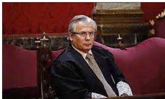
El juez Baltasar Garzón

Baltasar Garzón es un juez de la Audiencia Nacional , la más alta jurisdicción penal española (apodado “el superjuez”, fue él quien pidió la extradición de Pinochet en 1998). En 2007 varias asociaciones presentaron denuncias ante la Audiencia Nacional para la investigación de los crímenes y desapariciones del franquismo. La Audiencia alegó que los delitos habrían prescrito o estaban sujetos a la Ley de amnistía . No obstante, Garzón se declaró competente para instruir el caso, recalificó los delitos de crímenes de lesa humanidad (imprescriptibles), y procesó a Franco y a altos cargos del franquismo por genocidio en 2008.