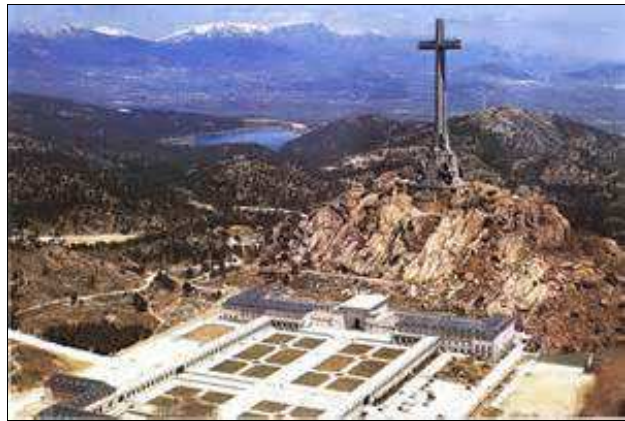
Valle de los Caídos (Comunidad de Madrid)