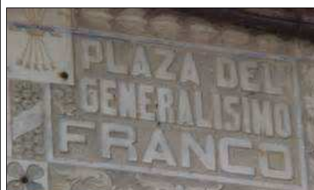
Retirada de símbolos