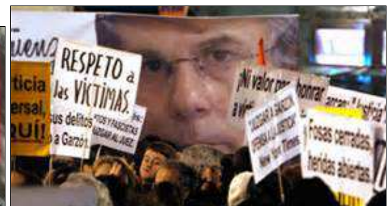
Manifestaciones de apoyo a Garzón

En febrero de 2012 el Tribunal Supremo absolvió a Garzón de la acusación, pero lo inhabilitó por 11 años y lo expulsó de la carrera judicial por las escuchas ilegales en el marco del caso Gürtel (trama de corrupción en el PP). Ejerce hoy en la Corte Penal Internacional de La Haya.