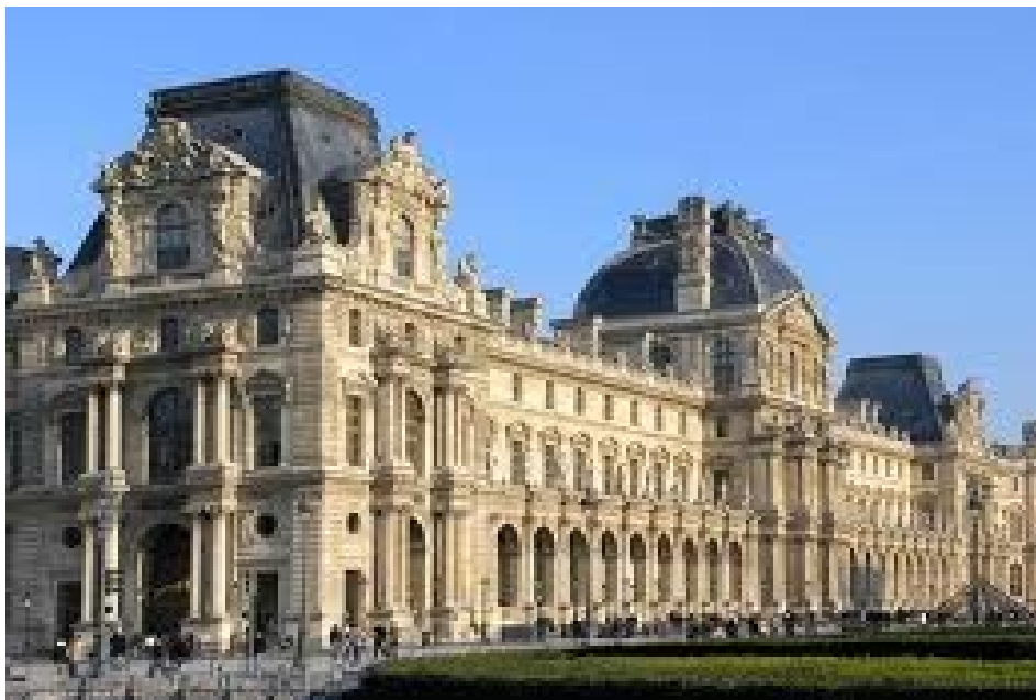
Le Louvre – aile Richelieu

La Convention inaugure le nouveau musée des arts. L'ancienne résidence des rois de France, de François Ier à jusqu'à Louis XIV, devient le plus beau musée de France. Sous l'Empire Le Louvre deviendra le musée Napoléon.