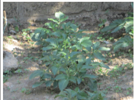
Les pommes de terre