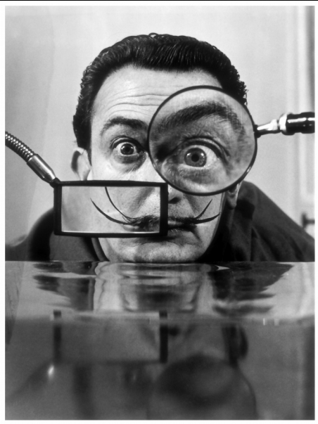
Salvador Dalí par Willy Rizzo, 1950

Un enfant palestinien dans la ligne de mire d'un sniper israélien, photo postée puis censurée sur Instagram