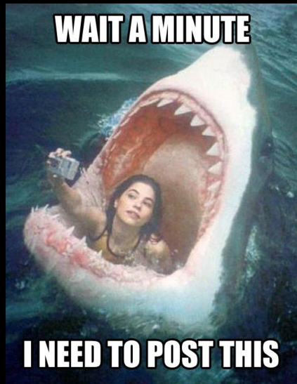
Publicité dénonçant le « Selfie »