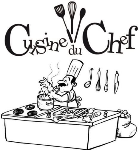
Il cuisine . - Il cuisine .