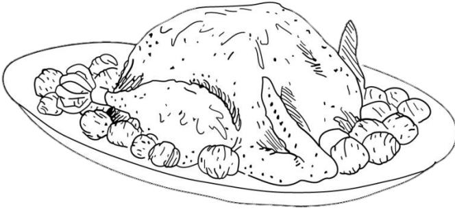
Une dinde aux marrons .