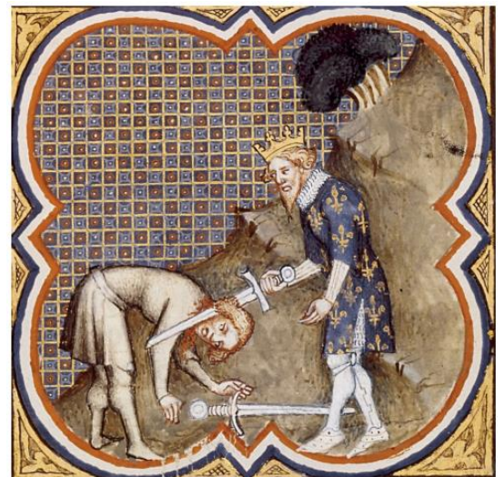
Vase de Soissons, enluminure du XIVème siècle