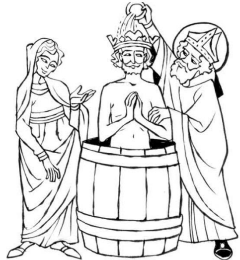
Baptême de Clovis