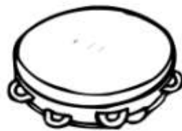
Un tambourin basque