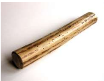
Un bâton de pluie