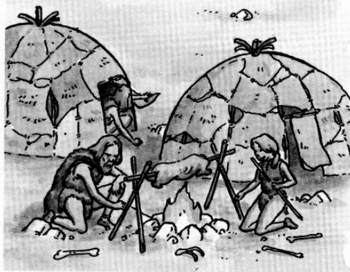
1. La préhistoire

Ce lieu a été occupé par les hommes préhistoriques, il y a très longtemps, puis par les Gaulois, par les hommes du Moyen Âge et par les hommes d'aujourd'hui. Chaque groupe a laissé des vestiges de son passage (objets jetés ou perdus...). Peu à peu, les vestiges sont enfouis dans le sol : les objets les plus anciens sont profondément enterrés, les plus récents sont au-dessus. Chaque « étage » du sol est appelé « couche archéologique ».