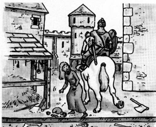
3. Le Moyen Age