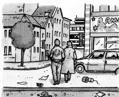
4. L'époque actuelle