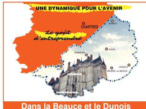
Dans la Beauce et le Dunois

A juste titre, l'enclavement du sud et de l'est de notre Département a souvent été évoqué par beaucoup de responsables politiques, économiques et touristiques comme un obstacle à son développement.