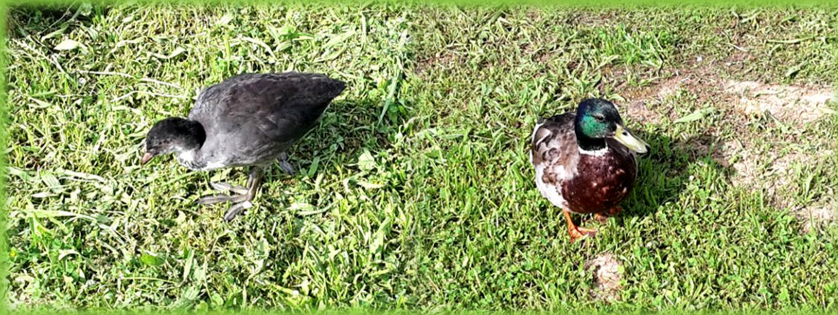
Montage d'Emérance Bétis - 18 juin 2019