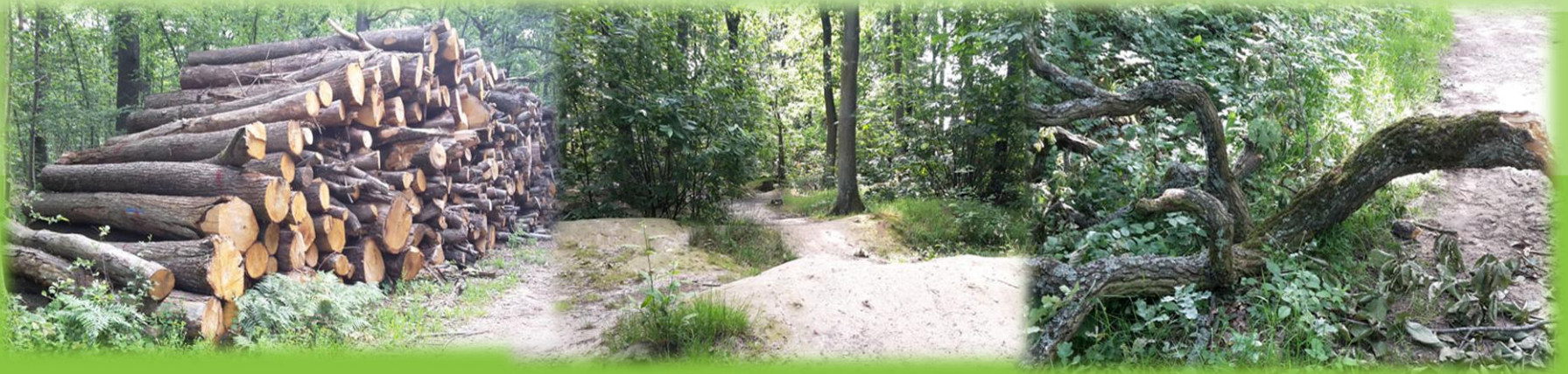
Dans la forêt