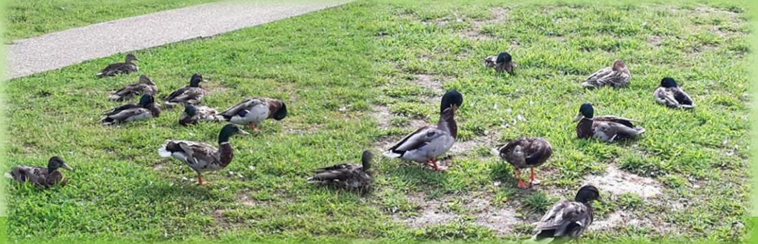
Des oiseaux en pagaille sur le plan d'eau