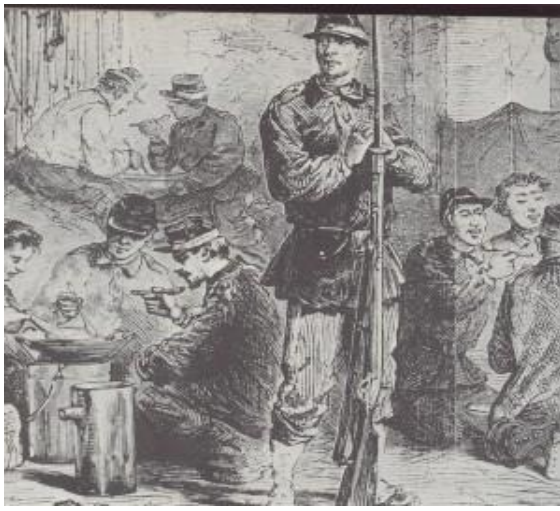
Gwarded-red breizhat, 1870

http://recherches.historiques-leconquet.over-blog.com