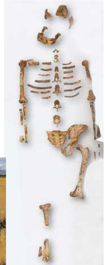
Squelette de Lucy - 3,2 millions d'année

1. Dans quel pays les ossements de Toumai ont-il été retrouvés ?