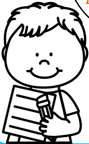
Série A - 1 à 5

Chaque jour, j'apprends 5 mots puis je me fais interroger (par mes parents ou par un camarade de classe). Si le mot est bien écrit, je colorie un rond en vert . Au bout de 3 ronds verts , je suis prêt(e) pour la dictée.