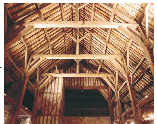
Grange aux dîmes de Samoreau (vue d'intérieur)

En Europe, des granges aux dîmes ont été construites dans les villages afin de stocker la dîme, impôt de l'ancien régime portant principalement sur les revenus agricoles collectés en faveur de l'Église catholique. Les paysans devaient offrir un dixième de leur récolte, alors que les artisans devaient offrir un dixième de leur production.