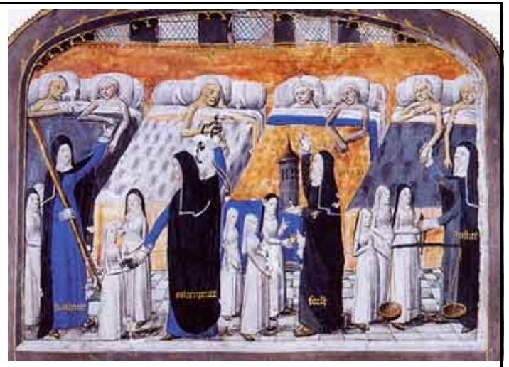
Une salle de l'Hôtel-Dieu de Paris, manuscrit du XV ème siècle