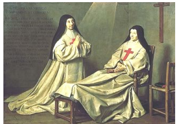
Religieuses en prière