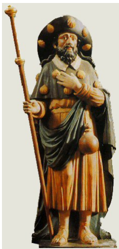
Pèlerin de Saint-Jacques de Compostelle