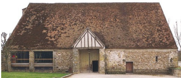
Grange aux dîmes de Samoreau

En Europe, des granges aux dîmes ont été construites dans les villages afin de stocker la dîme, impôt de l'ancien régime portant principalement sur les revenus agricoles collectés en faveur de l'Église catholique. Les paysans devaient offrir un dixième de leur récolte, alors que les artisans devaient offrir un dixième de leur production.