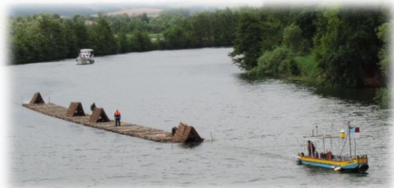
16 juin 2015, le train de bois quitte Étigny pour rejoindre la capitale