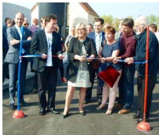
Inauguration de la Station de Traitement des Eaux Polluées (STEP), située sur la commune d'Étigny, le 24 avril 2015