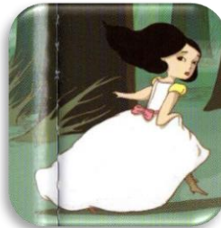
Blanche - neige