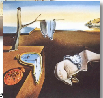
La montre molle