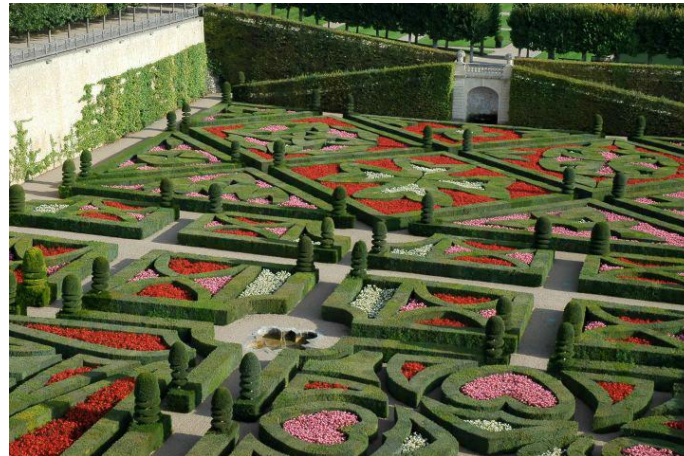
Le jardin du Château du Villandry