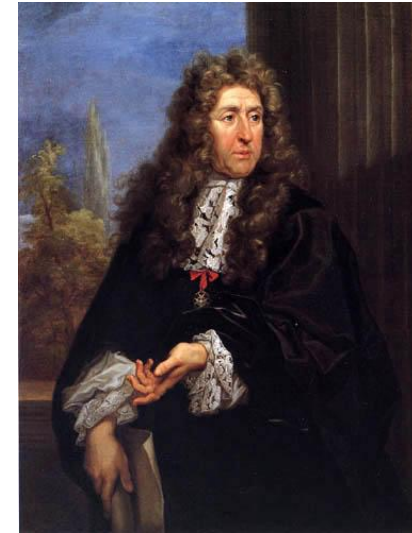
André Le Nôtre

Né en 1613 d'une famille de jardiniers, après s'être initié à l'architecture avec Mansart, il réalise sa première œuvre importante : le jardin de Vaux-le-Vicomte. Les jardins du château de Versailles constituent son œuvre la plus célèbre.