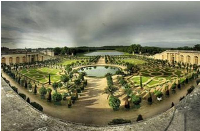
Les jardins du Château de Versailles

Né en 1613 d'une famille de jardiniers, après s'être initié à l'architecture avec Mansart, il réalise sa première œuvre importante : le jardin de Vaux-le-Vicomte. Les jardins du château de Versailles constituent son œuvre la plus célèbre.