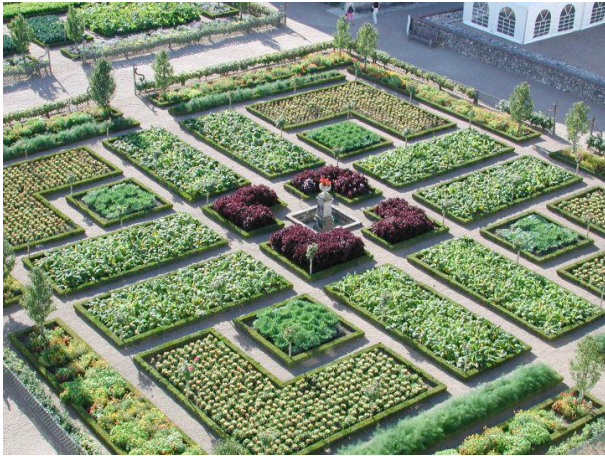
Le jardin potager du Château du Villandry