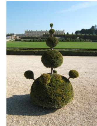
Des topiaires (Buissons sculptés)