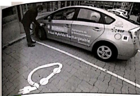
Doc. 4 Une voiture électrique.