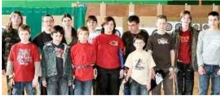
Les jeunes sportifs luynois de la section tir à l'arc de l'ASL.

Le moral était tout de même au beau fixe dimanche après-midi pour les 38 sportifs inscrits, en majorité des Luynois mais aussi en provenance des clubs Ufolep de Ballan, Saint-Étienne-de-Chigny, Sainte-Maure, Sonzay et Villeperdue. Les parents des jeunes luynois