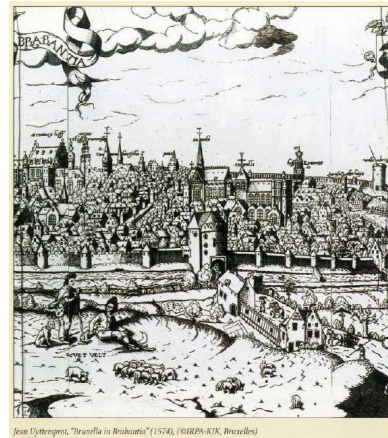
Jean Luytens, "Bruxella in Brabantia" (1574), (BRPH-ATK, Bruxelles)

Il y a bien longtemps, mille ans environ, il existait seulement un château-fort, appelé castrum, bâti sur une petite île formée par la Senne : c'était l'île Saint-Géry.