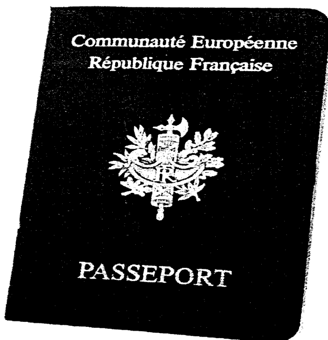
Passeport européen délivré par la France.