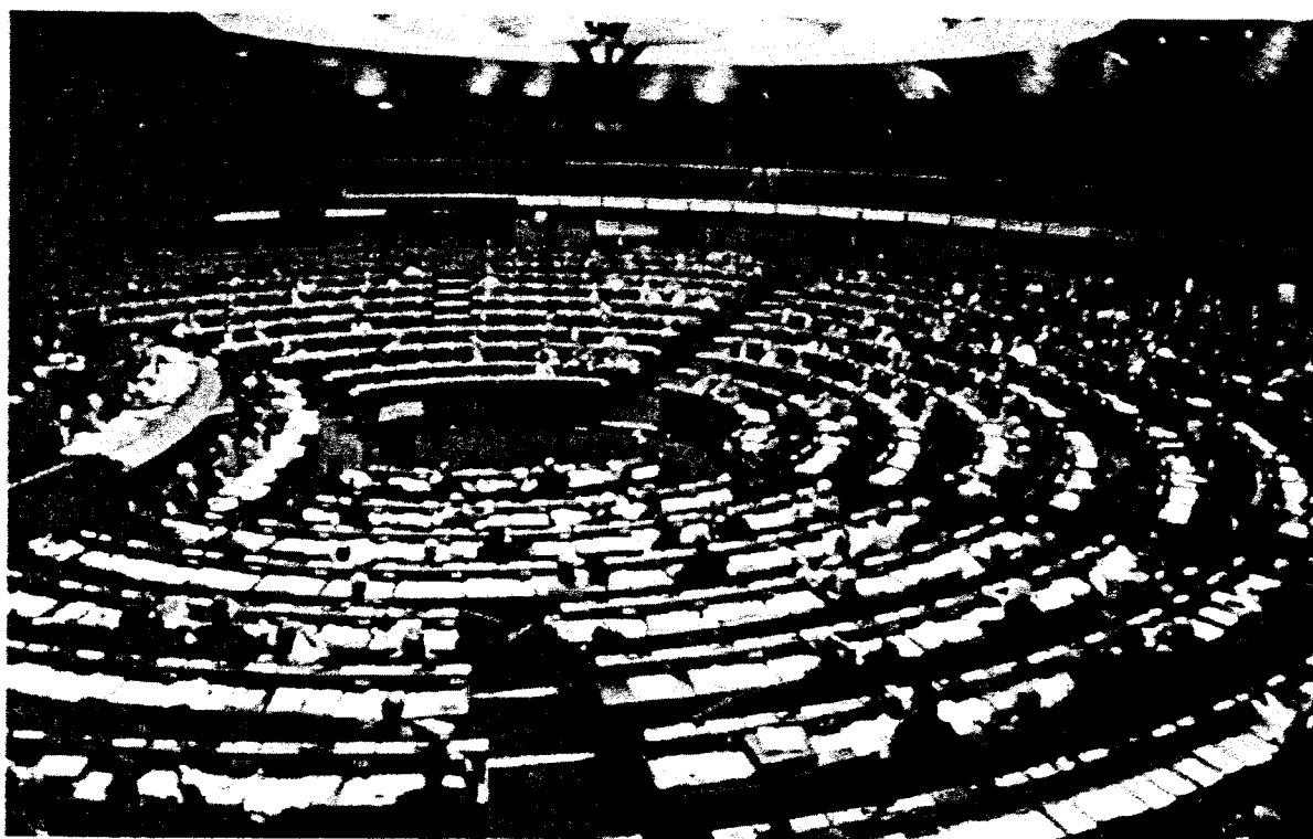
Parlement Européen / Palais de l'Europe à Strasbourg

Le Parlement européen (PE) est l'émanation démocratique des peuples d'Europe. Directement élus tous les cinq ans, les membres (MPE) du Parlement européen siègent, non pas par nationalité, mais par affinité politique.