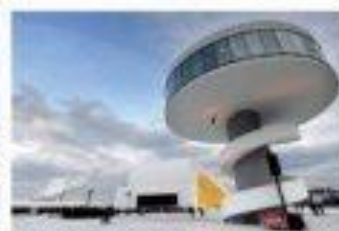
Centre culturel international Niemeyer (2011) à Avilés, Espagne