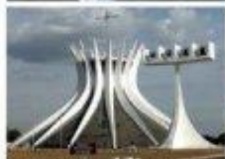
Cathédrale de Brasilia (1960)