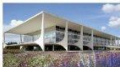
Palais de Planalto siège du gouvernement (1960) à Brasilia