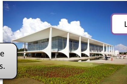
Le temple da Paz