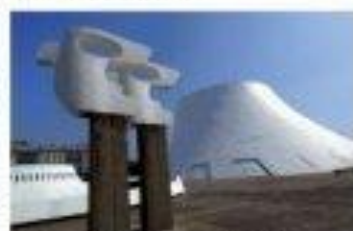
Maison de la culture Le Havre (1983)