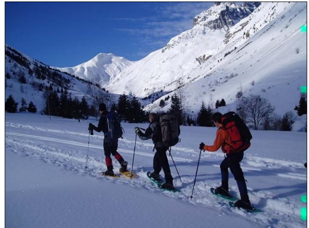
▲ Des touristes faisant une balade en raquettes.

→ Parmi les cinq types d'espaces touristiques que tu connais, auquel appartient Châtel ?