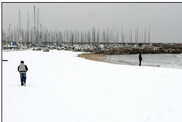
▲ Une plage en hiver, sous la neige.

→ Par quels moyens de transport les touristes peuvent-ils se rendre à La Grande-Motte ?