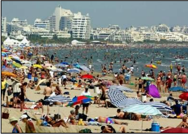
▲ Une plage de La Grande-Motte en été.