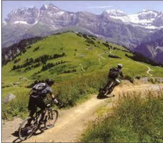
▲ Des touristes pratiquant le V.T.T.