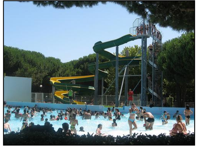
▲ Le parc aquatique de La Grande-Motte.