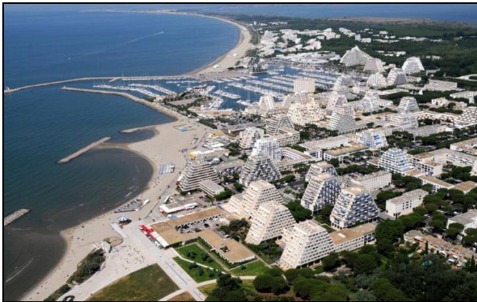
▲ La station de La Grande-Motte vue d'hélicoptère.