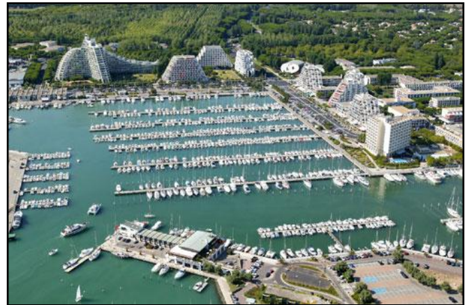
▲ Le port de plaisance de La Grande-Motte.

→ Parmi les cinq types d'espaces touristiques que tu connais, La Grande-Motte appartient auquel ?