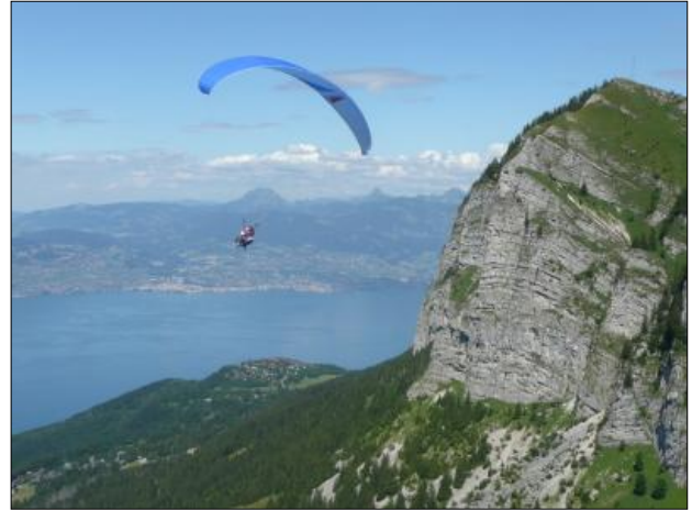
▲ Un touriste pratiquant le parapente.