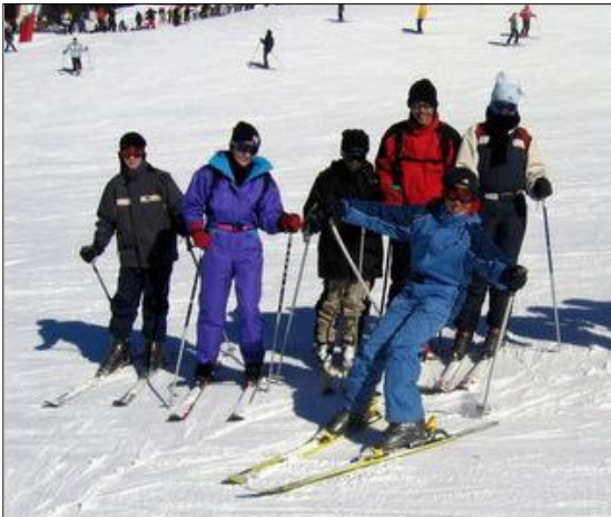
▲ Des touristes skieurs.