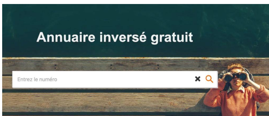
Annuaire inversé 118 712 © Orange