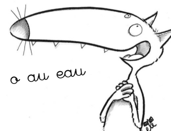
Illustration Éléonore Thuillier