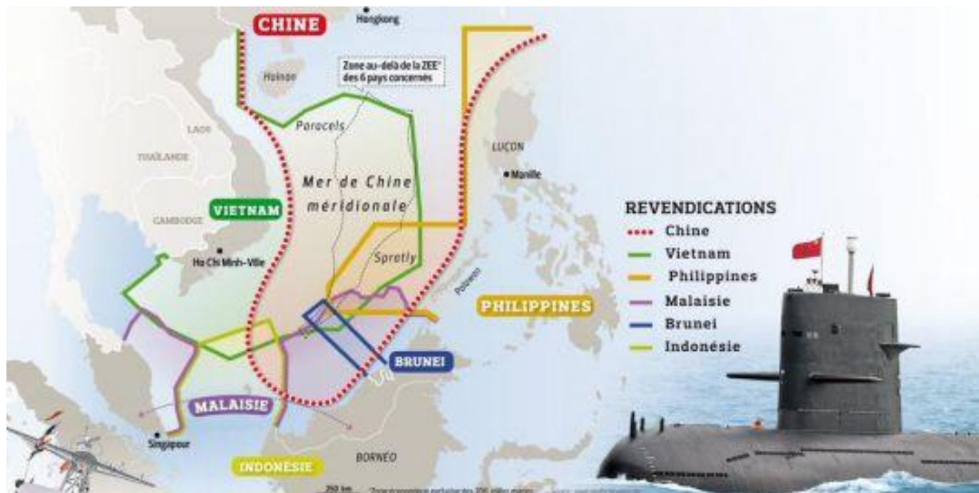
Carte représentant les revendications des pays riverains de la mer de Chine méridionale.

Axe maritime majeur et zone riche en ressources énergétiques, la mer de Chine méridionale n'a cessé, ces derniers mois, d'aiguiser les appétits des pays d'Asie du Sud-Est. Au premier rang desquels la Chine, soucieuse de préserver son influence et ses intérêts économiques.