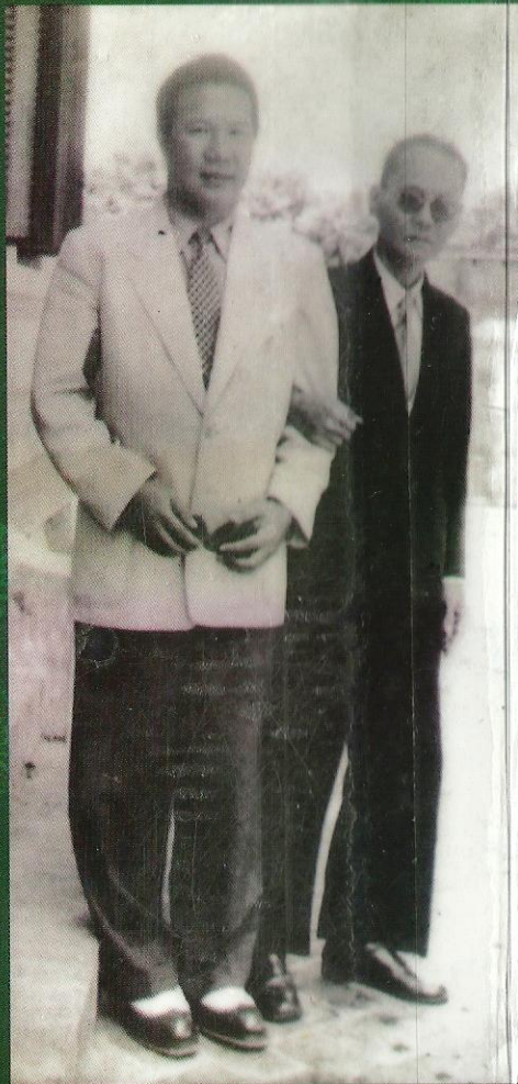
Cựu hoàng Thành Thái và Bảo Đại (Đà Lạt 1951)