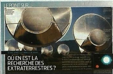
OÙ EN EST LA RECHERCHE DES EXTRA-TERRESTRES ?