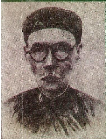
Cựu hoàng Thành Thái "hồi hương" năm 1947 từ Vũng Tàu lên Sài Gòn 1949