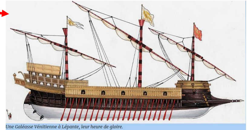
Une Galéasse Vénitienne à Lépante, leur heure de gloire.