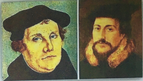
Doc 1 : Luther et Calvin

Vers 1520, un moine allemand appelé Luther critique fortement l'église catholique. Il pense que le clergé ne donne pas bon exemple : les curés sont ignorants, les évêques et les papes font mal leur travail et vivent dans le luxe. Il crée la première église protestante. Vers 1540, le Français Calvin introduit en France les idées de cette réforme.