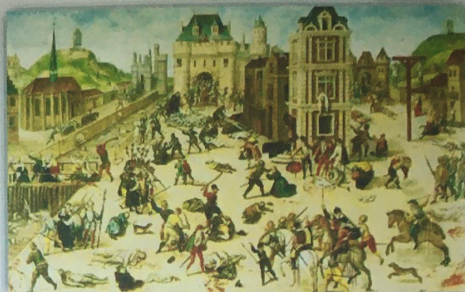
Doc 3 : Le massacre de la Saint Barthélémy

De 1562 à 1598, huit guerres de religion opposent les catholiques et le roi aux protestants. L'épisode le plus connu est le massacre de la Saint Barthélémy dans la nuit du 23 au 24 août 1572. Des milliers de protestants sont tués à Paris et en Province.