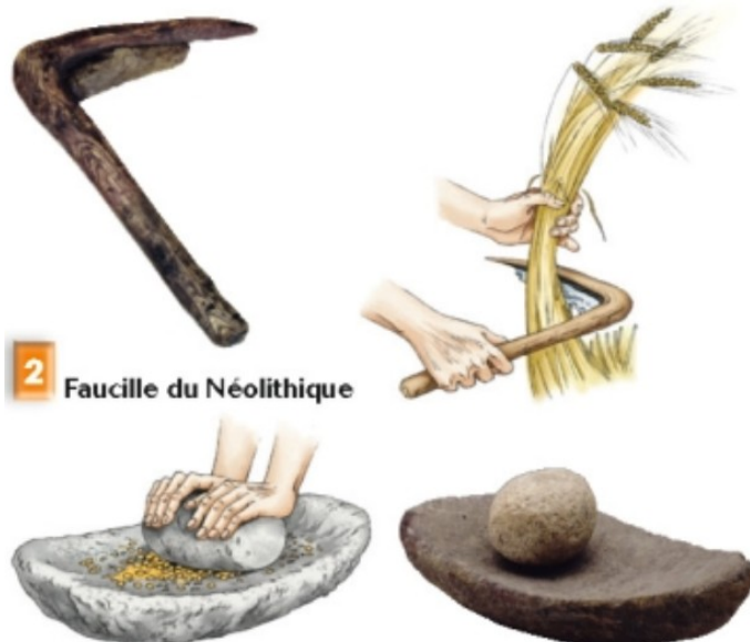
2 Faucille du Néolithique