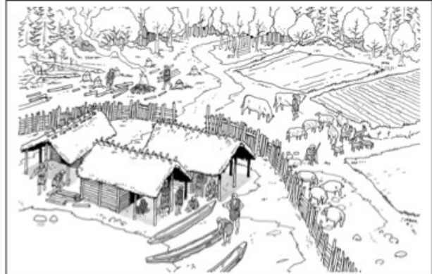
Voici les maisons des hommes du néolithique qui étaient SEDENTAIRES