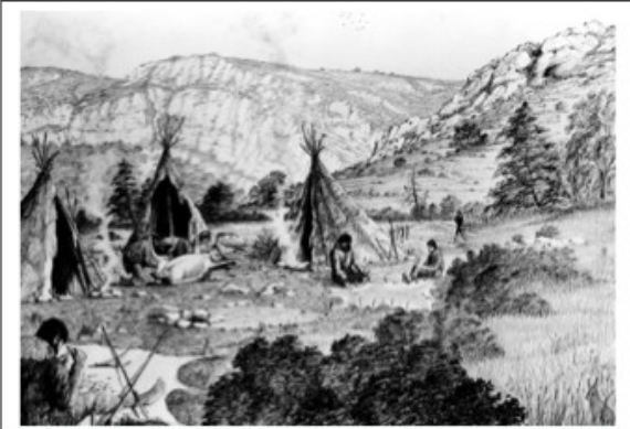
Voici des tentes des hommes du paléolithique qui étaient NOMADES