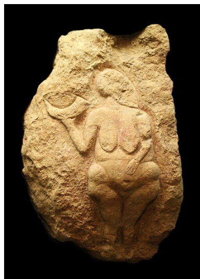
Art sur bloc: Vénus de Laussel