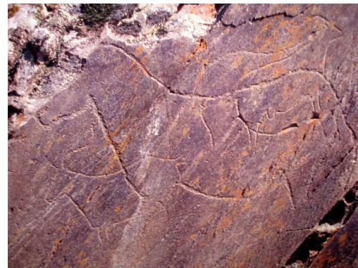
Art rupestre (sur roche, à l'air): vallée de Côa