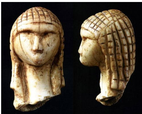
Art mobilier (qu'on peut déplacer): Dame de Brassempouy