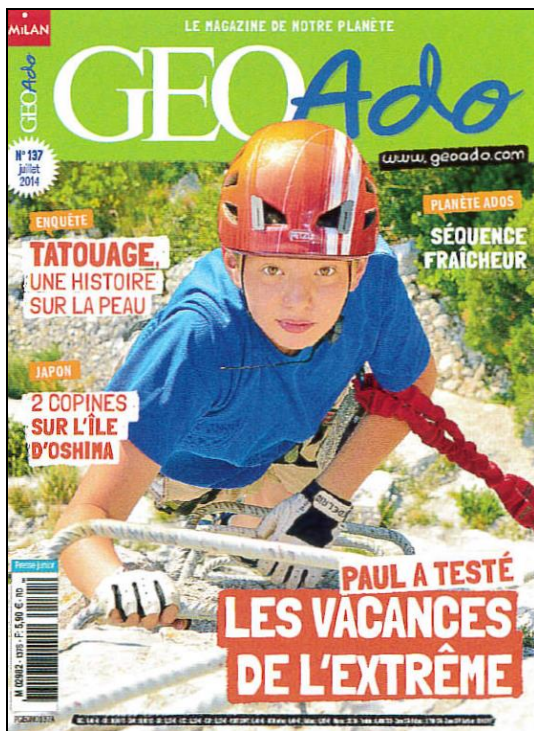
Doc. 1 : Des vacances parfois sportives.

Couverture du magazine Géo ADO , n°137, août 2014, © Milan Presse.